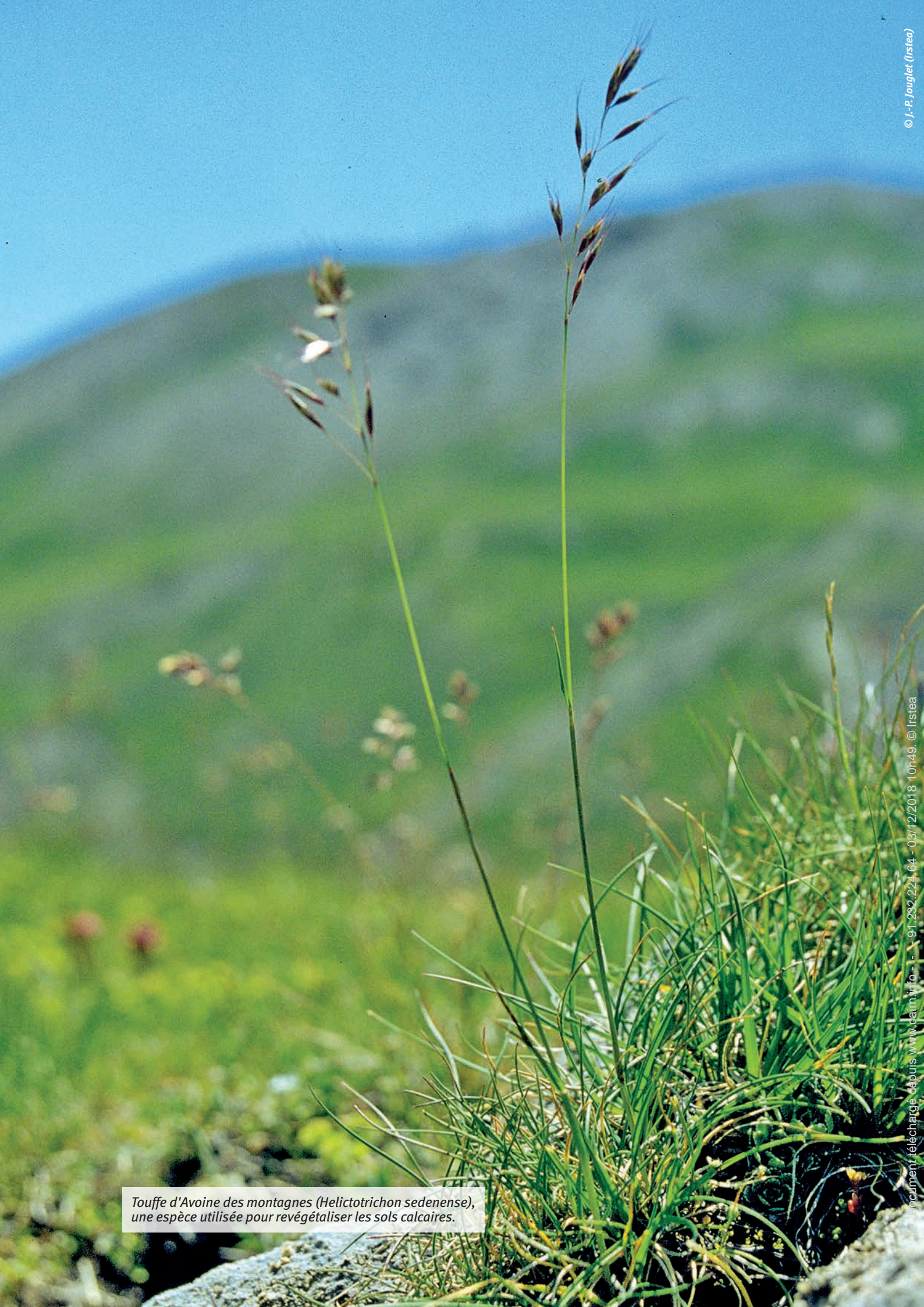
Touffe d'Avoine des montagnes ( Helictotrichon sedenense ), une espèce utilisée pour revégétaliser les sols calcaires.