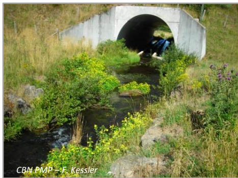
CBN PMP – F. Kessler