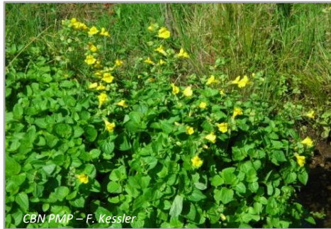
CBN PMP – F. Kessler

Plante annuelle ou stolonifère dressée de 80 cm de haut à feuilles opposées, ronde à ovale, densément glanduleuses et pubescentes dessous, à marge dentée à lobée. Fleurs tubulaires jaune vif, de 2 à 4,5 cm de long, à gorge ouverte poilue et glanduleuse, disposées en grappe lâche. Risque de confusion avec Erythranthe moschata (port plus prostré).