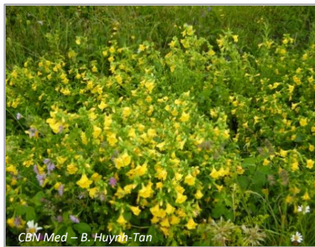
CBN Med – B. Huynh-Tan