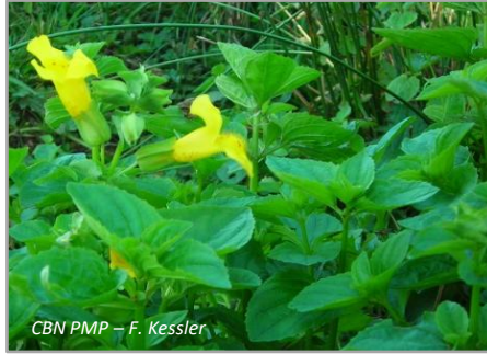
CBN PMP – F. Kessler