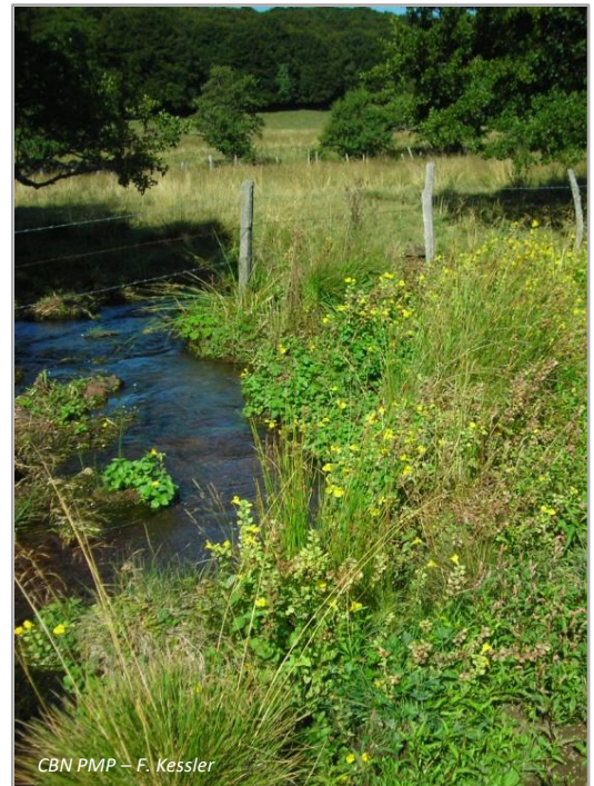
CBN PMP – F. Kessler