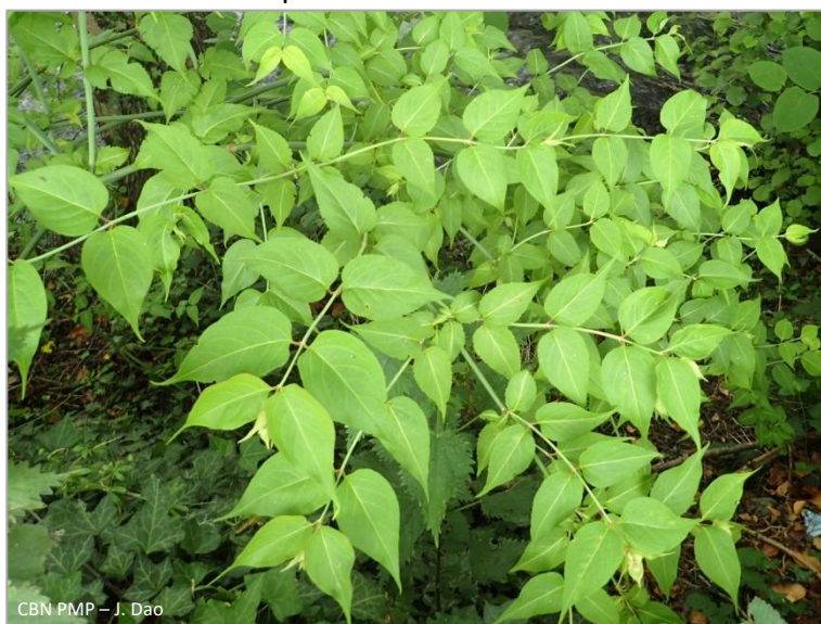
CBN PMP – J. Dao

Arbuste atteignant 2 à 3 m, très ramifié à tiges vertes et creuses. Feuilles atteignant jusqu'à 24 cm de long et 9 cm de larges, opposées, polymorphes mais principalement ovales, tronquées à la base du limbe et acuminées. Inflorescences en grappes à bractées violacées-rougeâtres et corolles blanches. Floraison de juin à octobre. Baies brunâtres à violettes de 7 à 10 mm de diamètre. Aucune confusion possible.