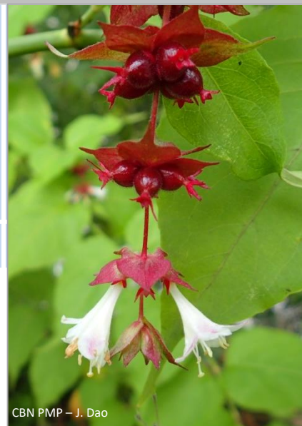
CBN PMP – J. Dao

Caprifoliacées • Herbacée • Vivace Originaire de l'Himalaya