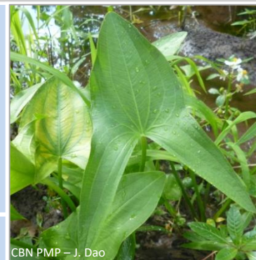
CBN PMP – J. Dao