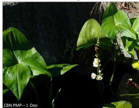
CBN PMP – J. Dao