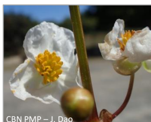
CBN PMP – J. Dao