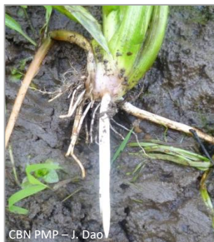
CBN PMP – J. Dao