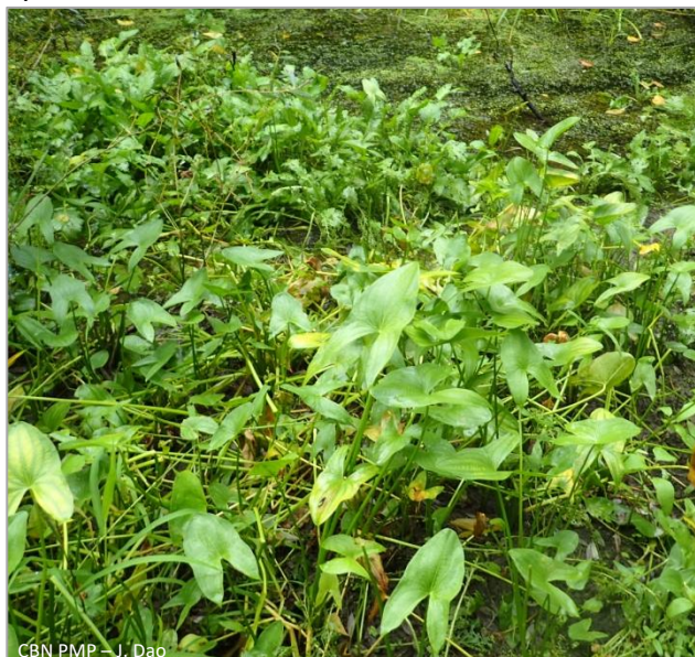
CBN PMP – J. Dao

Plante vivace rhizomateuse atteignant jusqu'à 1 m de hauteur. Feuilles aériennes à limbe en forme de flèche (sagitté), à sommet acuminé à obtus, insérées en rosette basale, avec un pétiole de 20 à 70 cm de long. Inflorescences blanches composées de 3 pétales blancs, réparties en grappes ou en panicules verticillées par 2, 3 ou 4 fleurs pédonculées. Floraison de juillet à septembre. Elle se distingue des autres espèces du genre Sagittaria par ses inflorescences entièrement unisexuées (fleurs mâles à anthères jaunes) et ses feuilles larges.