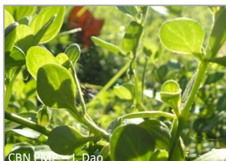
CBN PMP – J. Dao