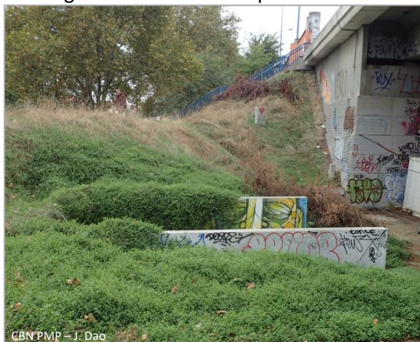
CBN PMP – J. Dao

Plante vivace rhizomateuse pouvant être grimpante ou rampante et atteindre jusqu'à 2 m de long. Tiges ligneuses pubescentes à nombreux rameaux prostrés. Feuilles vertes claires, alternes, pétiolées, à limbe ovale en forme de spatule, de 1 à 3 cm de long. Inflorescences blanches, en grélot, isolés, pendantes et insérés à l'aisselle des feuilles. Floraison de mai à octobre. Fruits de couleurs crèmes, ovoïdes et à odeur agréable, enfermant les graines dans une pulpe molle. Possibilité de confusion avec le genre Solanum au niveau des feuilles et des fleurs, mais s'en distingue assez nettement par ses fruits blancs.