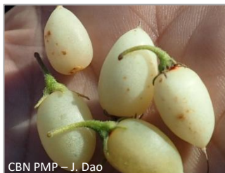
CBN PMP – J. Dao