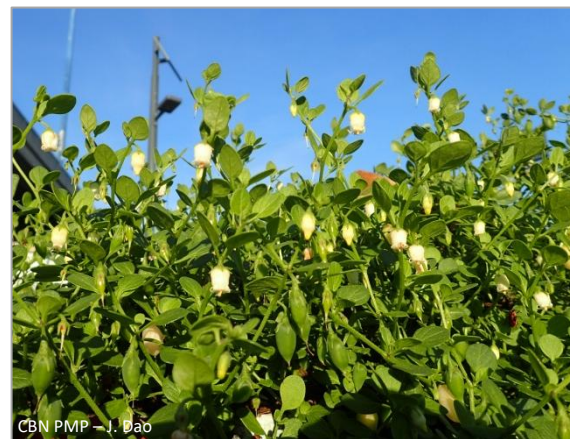
CBN PMP – J. Dao