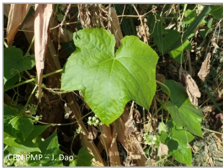
CBN PMP – J. Dao