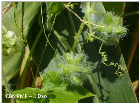
CBN PMP – J. Dao

Plante annuelle volubile, grimpant jusqu'à 10 m. Tige poilue, très ramifiée, à nombreuses vrilles tripartites. Feuilles alternes, larges (jusqu'à 20 cm x 15 cm), à 5 lobes. Fleurs mâles et femelles séparées, discrètes, à corolle blanc verdâtre (floraison : de juillet à septembre). Fruits velus. Confusion possible avec Bryonia dioica , indigène, liane ressemblante mais avec des vrilles simples et dont les fruits sont des baies.