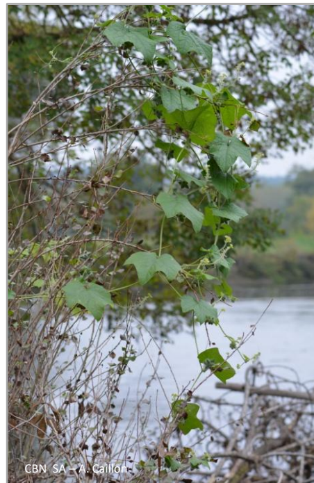
CBN SA – A. Caillon