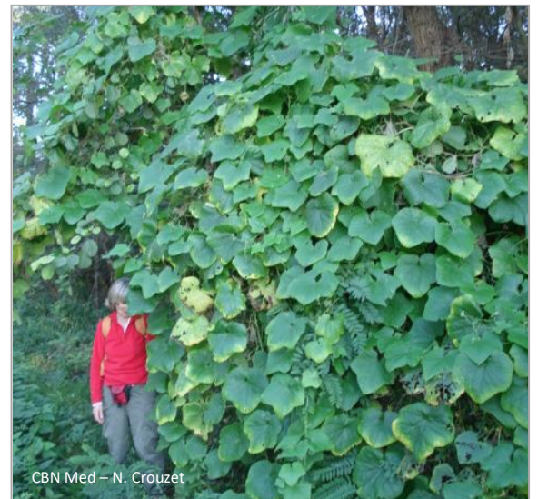
CBN Med – N. Crouzet