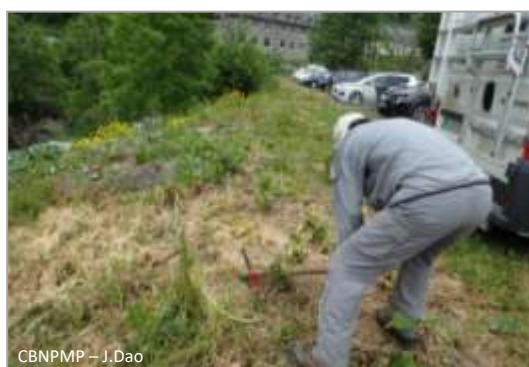
Action de coupe sous le collet

De plus, il est important de ne pas arracher les plantes autochtones afin qu'elles participent à la compétition envers les semis de Berce du Caucase.