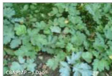
Semis de berce du Caucase

Les graines de Berce du Caucase peuvent germer jusqu'à 7 ans après leur dissémination, une intervention annuelle pendant au minimum de 7 ans est donc prévue.