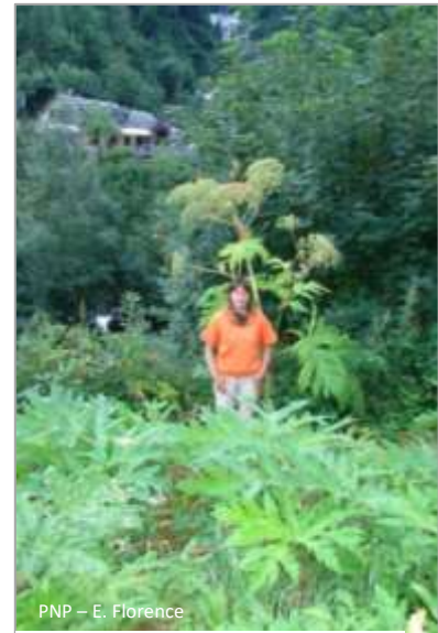
PNP – E. Florence

A partir de 2017, le CPIE 65 a rejoint le projet, s'impliquant plus particulièrement sur les efforts de médiation.