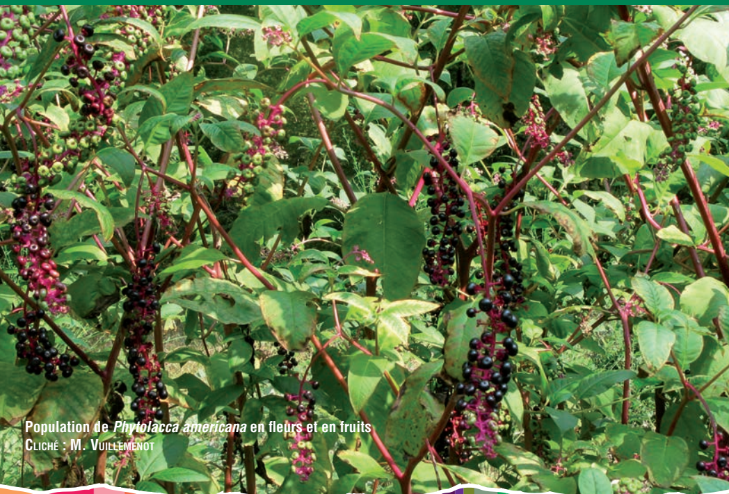
Population de Phytolacca americana en fleurs et en fruits