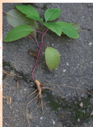
Jeune plant de raisin d'Amérique - CLICHÉ : M. VUILLEMENOT, 2012

Le raisin d'Amérique est une herbacée vivace atteignant deux à trois mètres de hauteur, dont les tiges robustes dépérissent en hiver. Ses grandes feuilles ovales lancéolées (jusqu'à 40 centimètres de long et 10 centimètres de large) ont des bords légèrement ondulés. Dressées lors de la floraison, les grappes de fleurs plient sous le poids des baies lors de la fructification et deviennent alors pendantes. Les dix carpelles sont soudés et forment une baie à dix loges, noire et charnue à maturité. Avec l'âge, l'appareil racinaire se structure en une puissante racine pivotante tubéreuse d'une dizaine de centimètres de large, comportant des racines secondaires plus ou moins horizontales, souples, et pouvant atteindre un mètre dans des sols sablonneux.