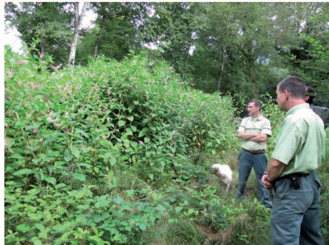
Taillis sous futaie soumis à un balivage ; l'éclaircie a généralisé un envahissement par le raisin d'Amérique. Ruffey-sur-Seille, Jura - CLICHÉ : L. MISCHLER, 2012

moyens de contrôle) pour leur permettre de réagir et d'agir suffisamment tôt contre cette espèce ;