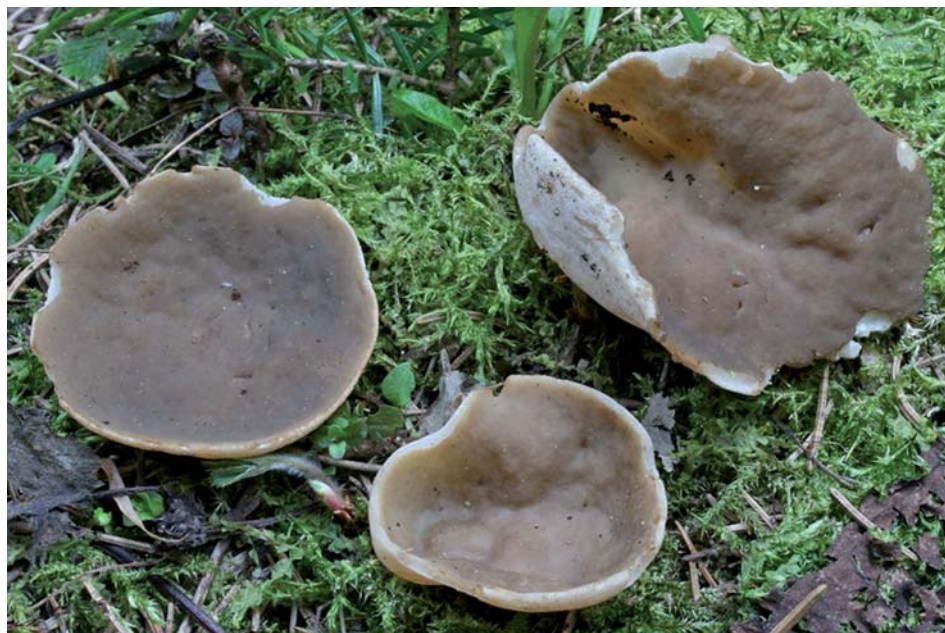
Gyromitra geogenia 25-IV-2009, Méaudre (Isère, France).