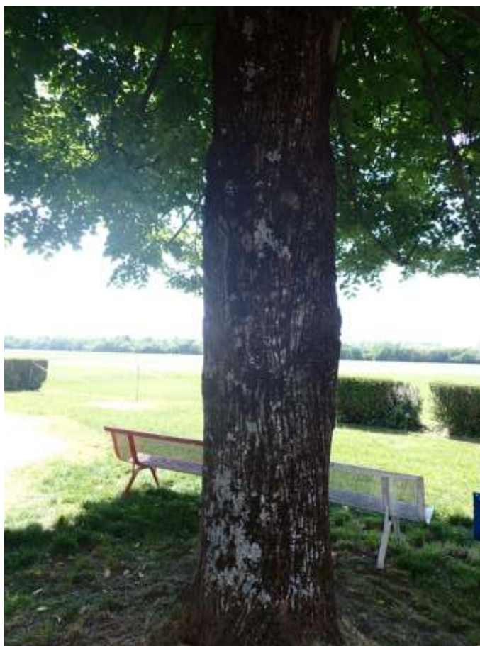
Figure 8. Groupements épiphytes sur tronc de tilleul.

Seuls 5 taxons ont été trouvés dans les différentes types de prairies , presque tous des pleurocarpes, comme on appelle les mousses les plus grandes et à croissance latérale.