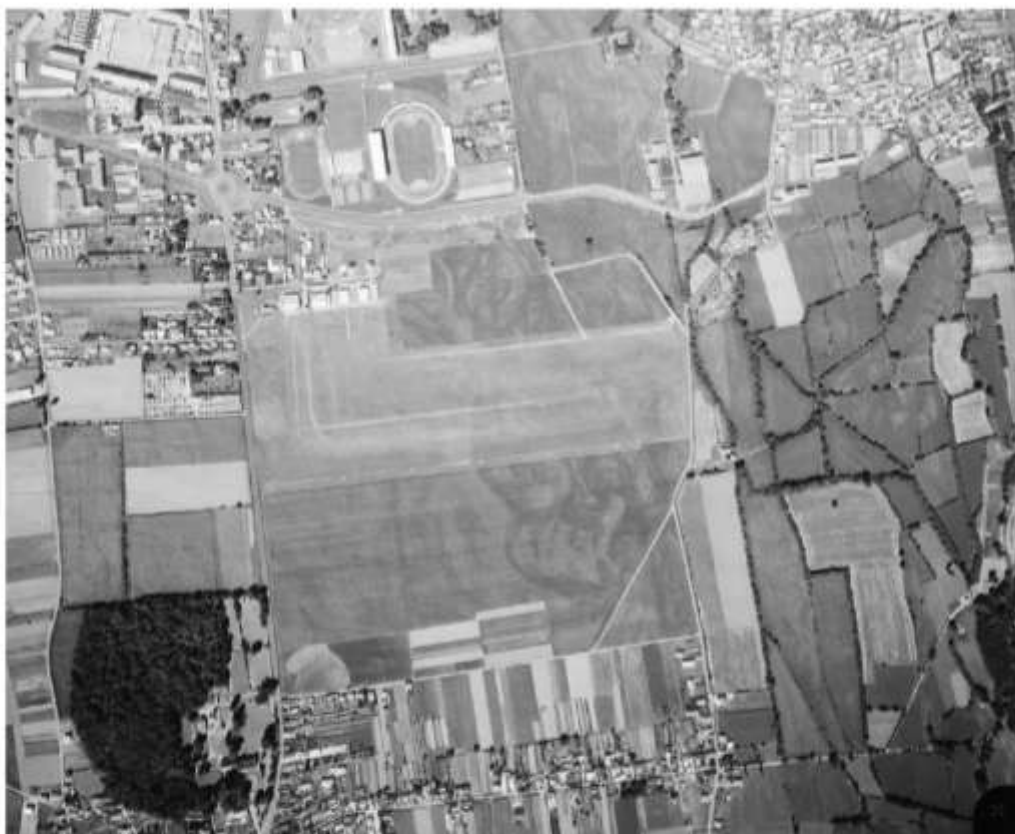
Figure 4 – 1970