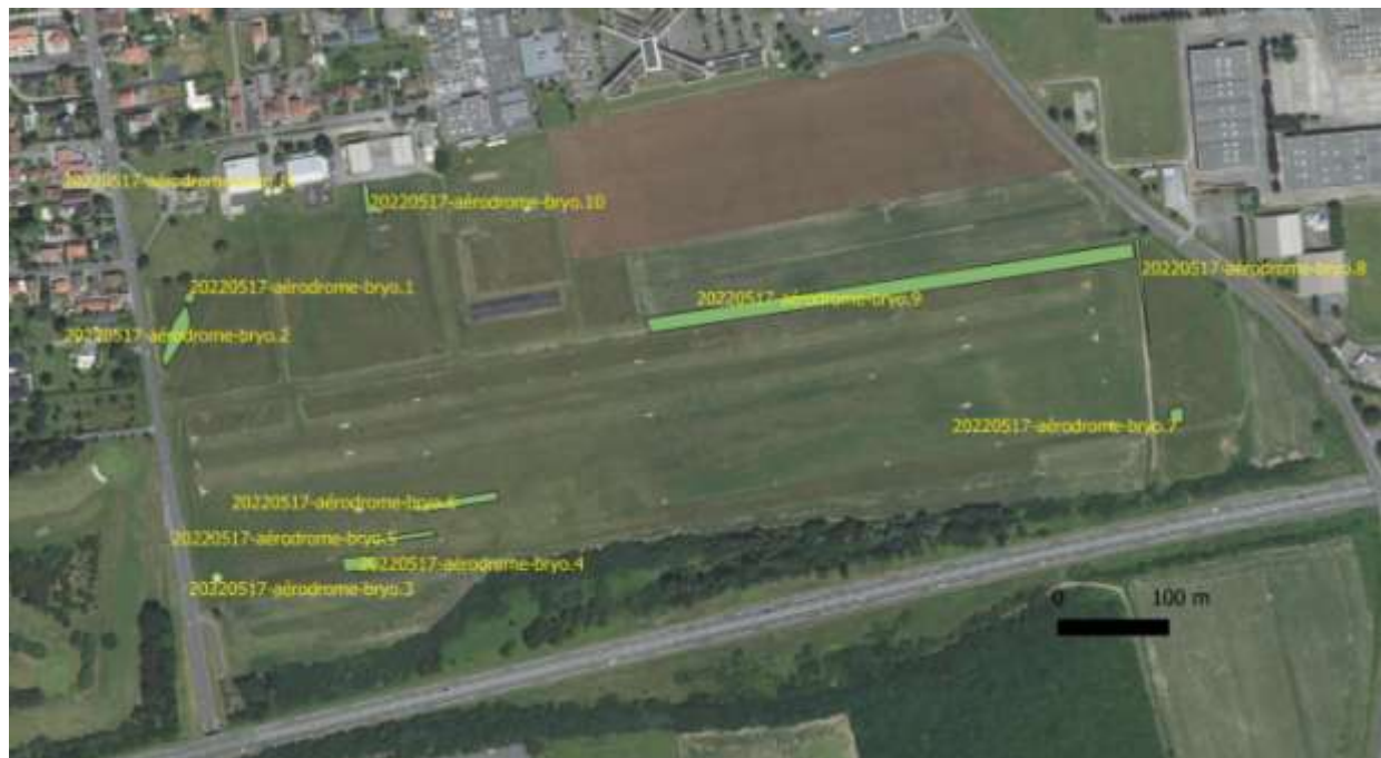
Figure 12. Relevés des bryophytes à l'aérodrome.