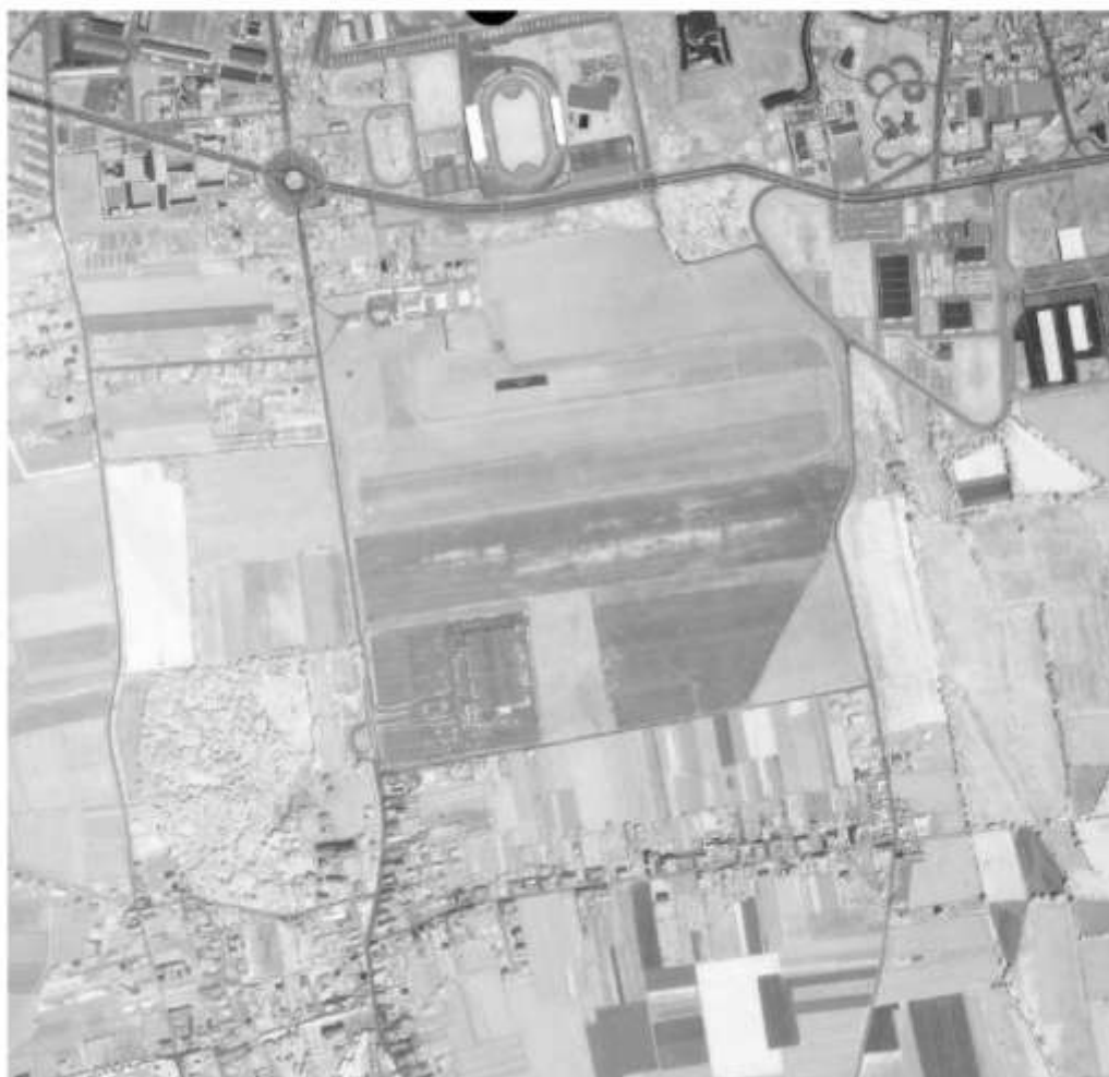
Figure 6 - 1983