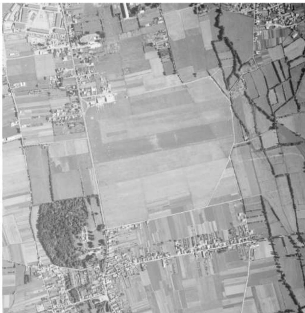
Figure 3 - 1962