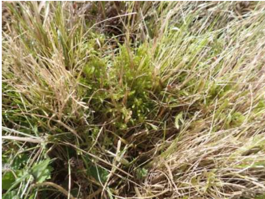
Figure 11. Pseudoscleropodium purum au nord-ouest de l'aérodrome.