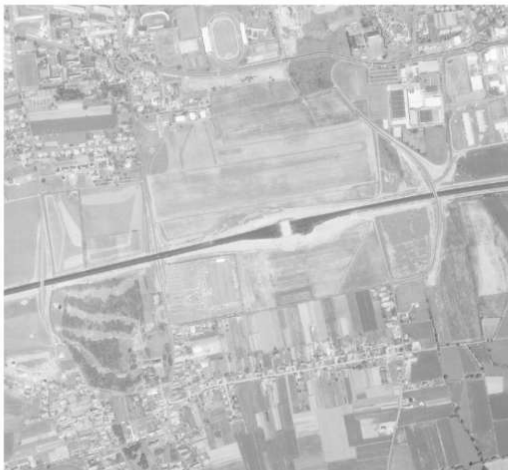
Figure 7 - 1988