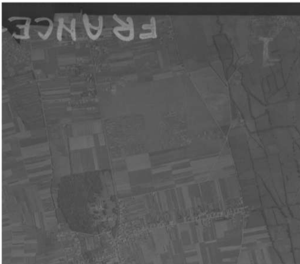
Figure 1 – 1945