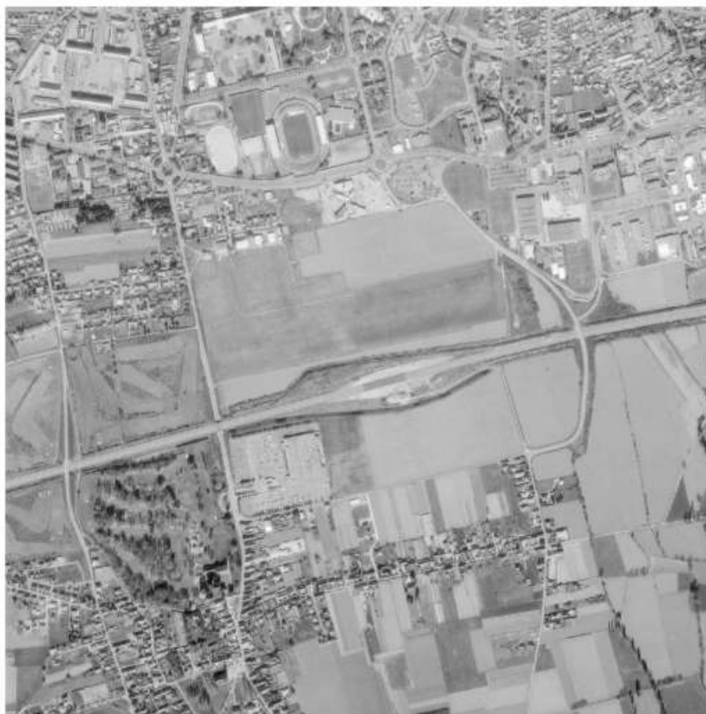
Figure 8 - 1997