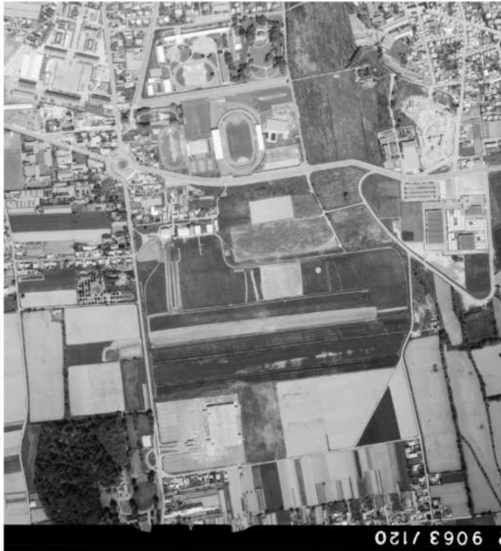
Figure 5 - 1978