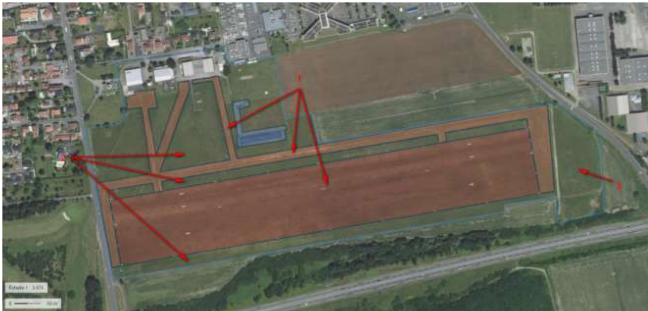
Figure 2 Différentes zones de l'aérodrome : 1- les pistes et accès aux pistes, régulièrement tondu à partir du mois de juillet ; 2- Les zones interstitielles, tondues extensivement (3 tontes par an) ; 3- une prairie occupant la partie la plus orientale du site, plus récente, issue de zone agricole, tondu extensivement. Les zones 1 et 2 anciennes, ont été par le passé sursemées (voir Annexe 2).