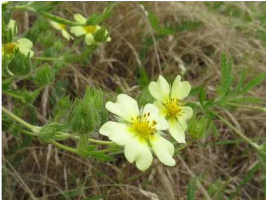
Figure 4 : Potentilla recta

Notons enfin la présence en populations importantes de la graminée exotique vivace envahissante Sporobolus indicus qui, bien que difficile à détecter lorsque les prairies sont à l'optimum de leur développement, se montre hégémonique sur des surfaces importantes à l'automne. On peut supposer que le développement de cette espèce très résistante à l'écrasement est favorisé sur les pistes et zones de circulation d'engins.