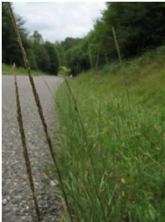
Figure 5 : Sporobolus indicus , espèce exotique résistante à l'écrasement des sols