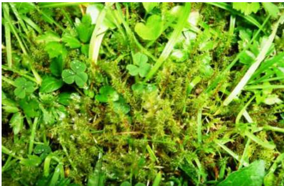
Figure 9. Rhytidiadelphus squarrosus sur un jardin à Tarbes.

Hypnum cupressiforme var. lacunosum est le taxon le plus thermophile et également le plus naturel dans des prairies relativement eutrophiles et avec des tontures. A l'aérodrome, il est répandu mais ne forme de beaux gazons à aucun endroit.