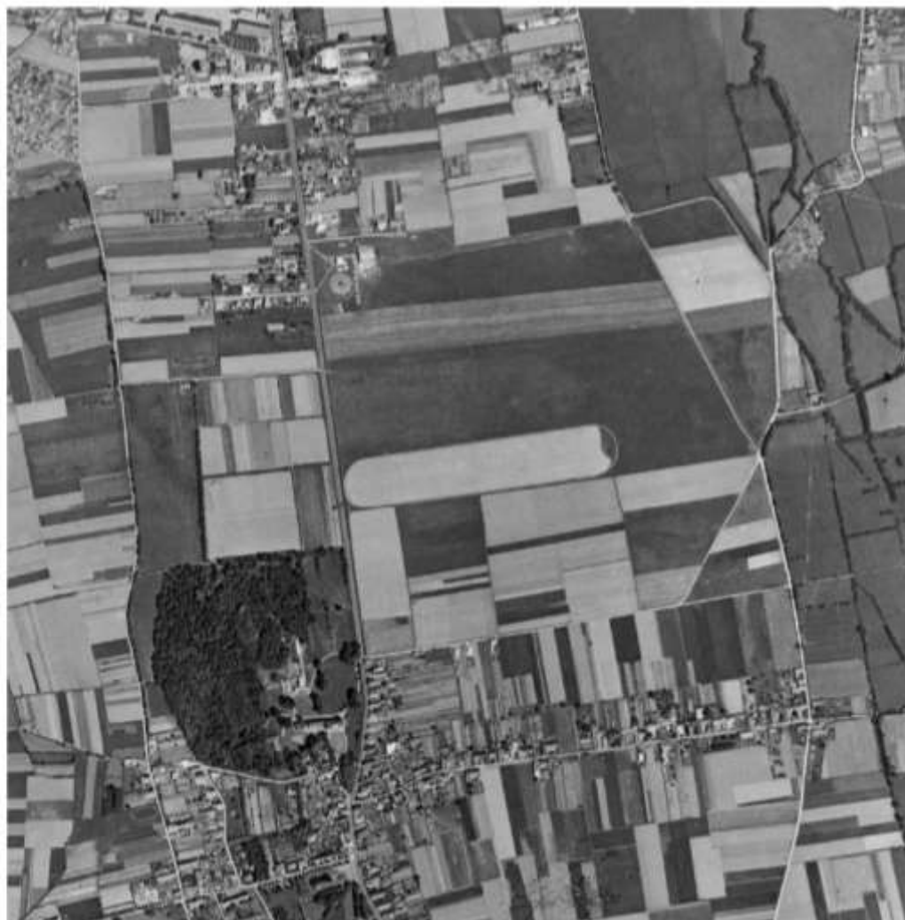
Figure 2 – 1954