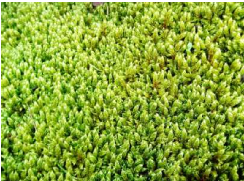
Figure 10. Hypnum cupressiforme var. lacunosum (pas à l'aérodrome).

Hypnum cupressiforme var. lacunosum est le taxon le plus thermophile et également le plus naturel dans des prairies relativement eutrophiles et avec des tontures. A l'aérodrome, il est répandu mais ne forme de beaux gazons à aucun endroit.