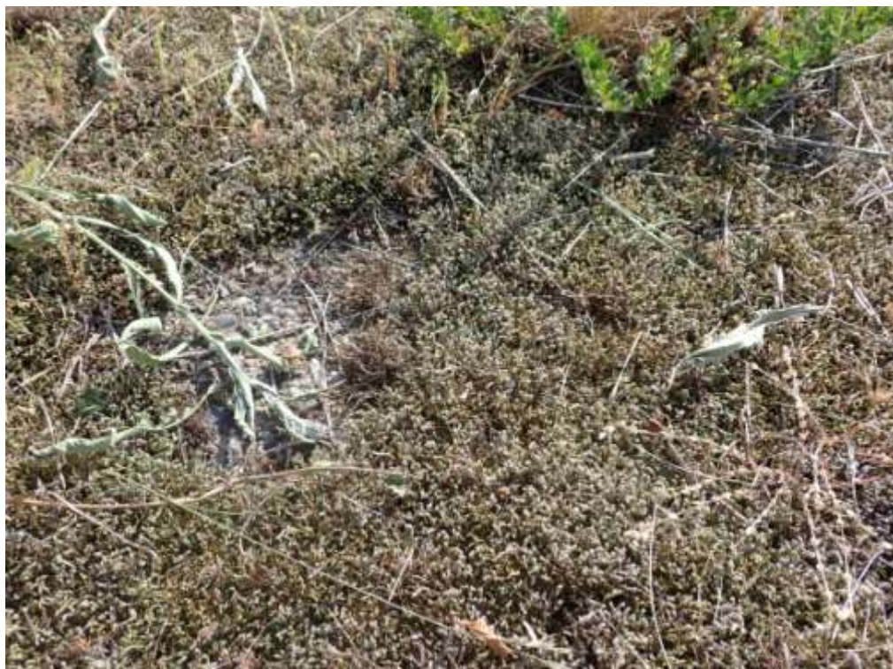
Figure 6. Hedwigia ciliata et H. emodica sur plaques de béton servant à l'orientation azimutale (20220517-aérodrome-bryo.1).

Les sols goudronés ou plaques de béton en service comptent moins de taxons (7), et sont notamment dominées par Pseudocrossidium hornschuchianum et Bryum argenteum , dans les fissures et bords, avec des recouvrements pauvres.