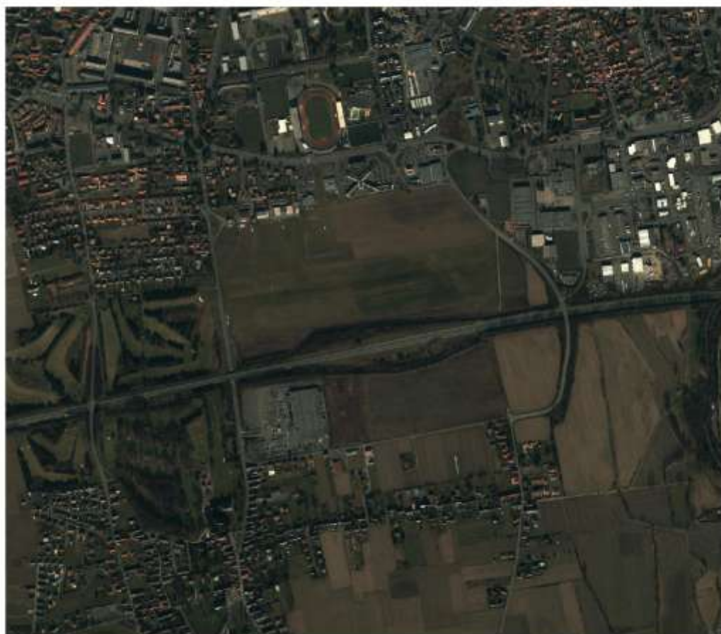
Figure 9 - 2011