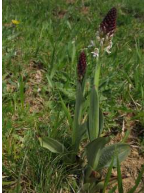
Figure 3 : Orchis ustulata , une orchidée des prairies maigres