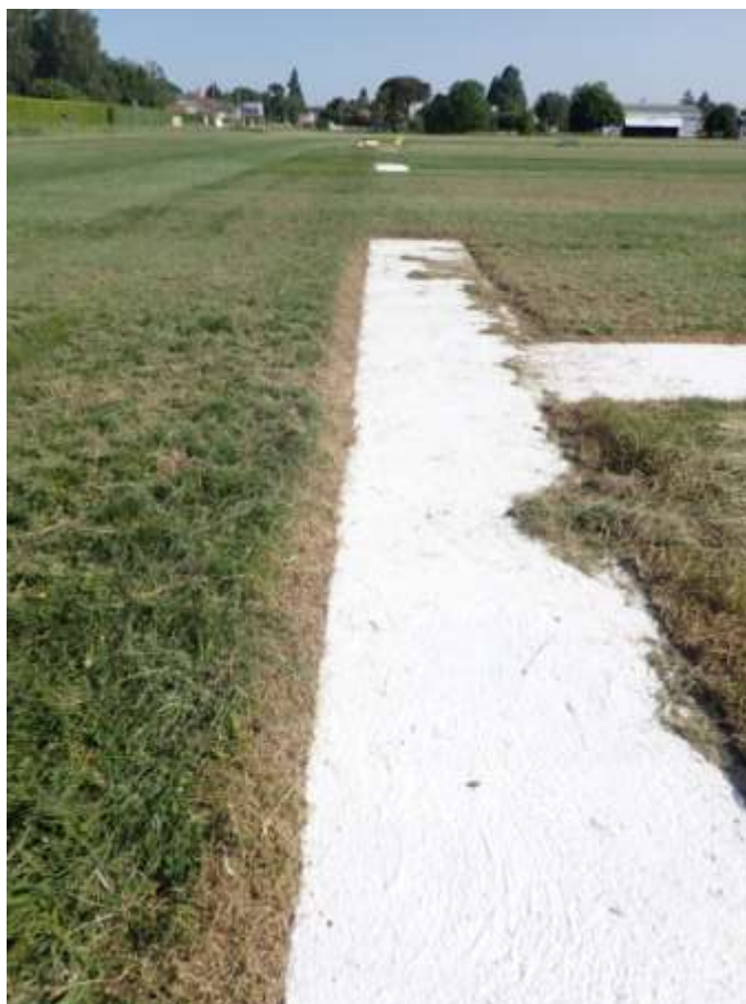
Figure 7. Plaques de béton en service.

Les troncs des tilleuls près des bâtiments et parking offrent un microhabitat favorable au développement des bryophytes épiphytes. Ces troncs ont une taille très importante, 8 espèces de bryophytes ont été recensées, et il faut noter qu'elles sont réparties soit sur la partie du tronc exposée au nord (la plupart, 5 d'entre eux), soit au sud (seulement 3 d'entre eux).