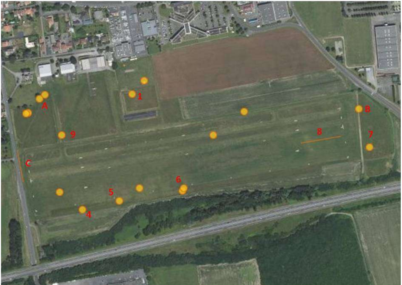
Figure 6 : localisation des relevés (ceux phytosociologiques numérotés)

A gauche du tableau figurent les relevés 1, 4, 5, 8, rattachables à l'association végétale du Lino biennis – Cynosuretum cristati Allorge ex Tüxen & Oberd. 1958 (sous-association brometosum mollis B. Foucault 1986), qui correspond aux prairies fauchées thermoatlantiques assez maigres. Les deux relevés de droite (6 & 7) illustrent une autre association végétale, dérivant de la première par eutrophisation : le Lino angustifolii – Brometum horderacei B. Foucault ex B. Foucault 2016. Le relevé 9 réalisé sur la zone principale d'accès aux pistes, à fauche pluriannuelle et tassement régulier montre un appauvrissement du Lino – Cynosuretum .