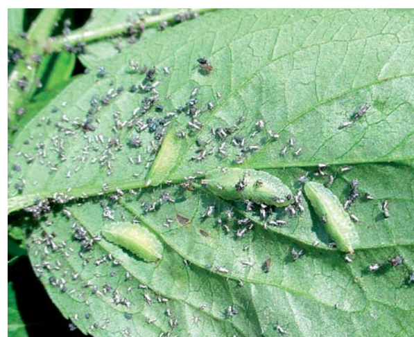
Larves d' Epistrophe eligans . Espèce des lisières, haies et bosquets de feuillus, ces larves sont prédatrices de pucerons sur végétaux buissonnants (ronce...), arbustifs (sureau noir...) et arborés (cerisier, chêne...).