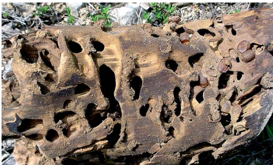
Pupes vides de Microdon analis (à droite). La larve vit aux dépens de celles de fourmis du groupe Lasius niger , ici dans une vieille souche écorcée de pin.

des Crassulacées, Renonculacées, Primulacées, Apiacées et Alliées. C'est d'ailleurs dans une Astéracée cultivée, l'artichaut Cynara scolymus , que C. vulpina commet des forfaits peu appréciés des agriculteurs bretons. Les quelques exceptions de ce genre sont C. aerea dont la larve se développe dans les feuilles pourrissantes de Verbascum sp., C. scutellata dont la larve est mineuse de champignons basidiomycètes des genres Boletus et Suillus , et C. morio dont la larve réussit quant à elle l'exploit de se développer dans les coulées de résine de Picea !