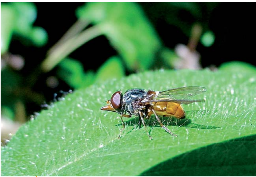
Rhingia rostrata mâle. Cette espèce forestière a disparu de plusieurs pays européens, sa larve est probablement associée au crottin de cheval en forêt.