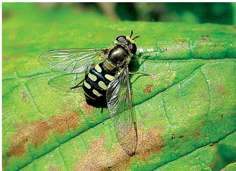
Eupeodes corollae femelle. Auxiliaire des cultures dont la larve se trouve souvent sur les plantes de la famille des Fabacées (légumineuses).