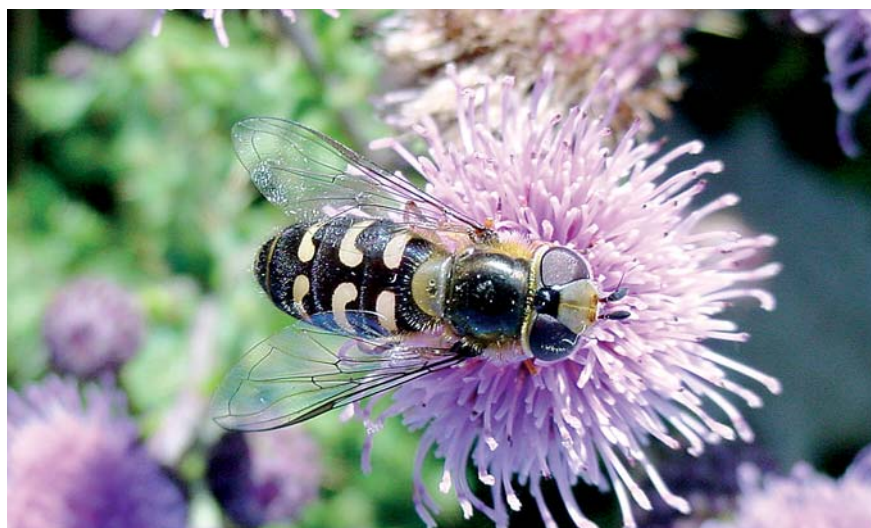
Scaeva selenitica femelle. Espèce des milieux mi-ouverts de diverses formations forestières, sa larve est aphidiphage sur arbustes et arbres, y compris en vergers.

base de données et modèle prédictif et exploratoire des communautés d'espèces des habitats européens (calqués le plus possible sur la codification Corine Biotope). Aussi remarquables et passionnants qu'ils soient, il faut reconnaître que leur détermination n'est pas encore très aisée pour quelques genres. Malgré tout, d'importants progrès ont été réalisés ces dernières années et un programme suisse, en cours, prévoit la réalisation et la mise en ligne sur Internet des meilleures clés de détermination dont beaucoup sont soit inédites, soit propres à Syrph the Net . À vos filets ou à vos tentes Malaise, la faune française, pourtant déjà la plus riche d'Europe ( http://syrfid.ensat.fr/ ), réserve encore à coup sûr bien des surprises car elle n'est pas la mieux connue. ■