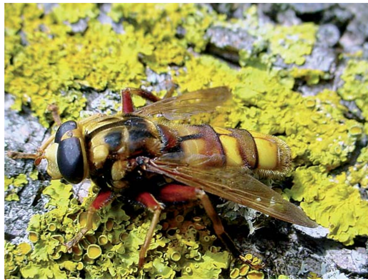
Milesia crabroniformis mâle. C'est la plus grande de nos espèces européennes ; elle vit dans plusieurs types de forêts décidues et sempervirentes et sa larve se développe dans les grosses cavités à terreau de vieux arbres.

lis, falaises et moraines, et enfin les agro-écosystèmes avec leurs cultures, jachères et zones de compensation écologique (haies, bords de champs, talus, friches...). Chacun de ces habitats, forestier ou non, abrite un assemblage d'espèces qui lui est propre, certaines de ces dernières seront chez elles dans une large gamme d'entre eux, voire dans tous ou presque (comme E. balteatus ), alors que d'autres n'éliront domicile que dans un nombre très réduit d'habitats, voire un seul et à condition encore qu'il ait un niveau d'intégrité écologique élevé (comme une vieille prairie na-