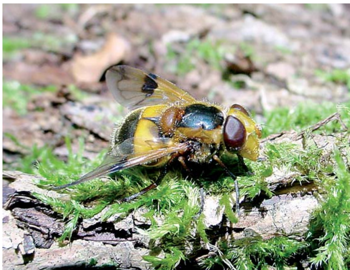
Volucella inflata femelle. Sa larve est microphage dans les amas d'humus et de déjections d'insectes xylophages imprégnés de sève en fermentation, dans divers types de forêts.

Microdon sur fleurs correspondent à des tentatives d'accouplement de mâles sur des orchidées du genre Ophrys , pour lesquelles ils sont de ce fait d'importants pollinisateurs.