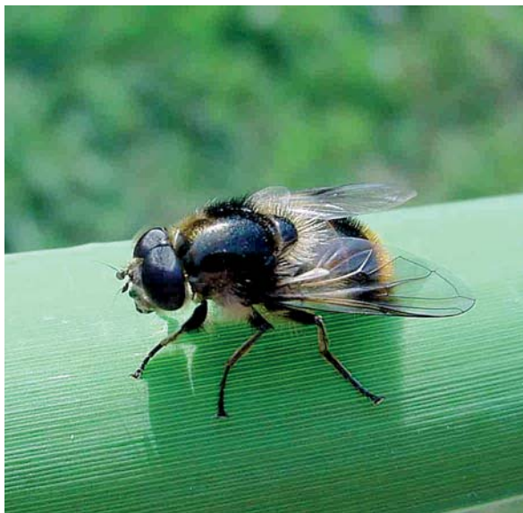
Cheilosia illustrata femelle. La larve de cette espèce de milieux boisés à climat frais ou de montagne vit en mineuse des tiges de grosses ombellifères (panais, berce commune).