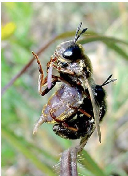
Microdon analis in copula. Espèce de forêts de types très divers mais toujours anciennes, avec des vieux troncs au sol colonisés par des fourmis du groupe Lasius niger .

travers pelouses montagnardes et escarpements rocheux à maigre végétation. Il est même fort possible que vous n'avez pas eu à vous déplacer si loin : une "fausse-guêpe" s'est probablement déjà invitée, fugacement, au calice des fleurs de votre jardin ou même de votre table. C'était une de ces quelques espèces (une dizaine maximum) qui sont encore là même après que l'homme ait fortement modifié l'environnement à son profit : les effluents d'élevage peuvent être le berceau de certaines larves alors que d'autres préféreront se repaître goulûment de dodus pucerons des blés, vidés sans pitié aucune de leur substance. L'adulte que vous avez vu auparavant effleurer la paille de votre verre était de ces dernières, c'est sûr.