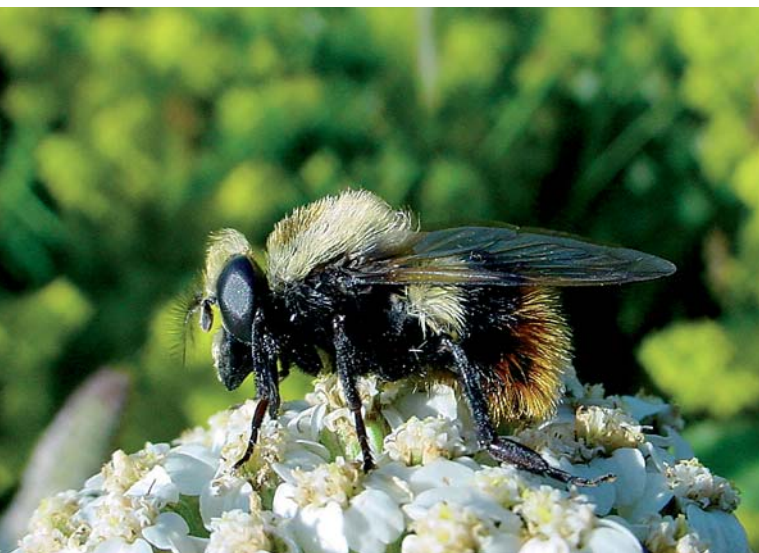
Volucella bombylans femelle, qui tire avantage de son habitus de bourdon pour pondre à l'entrée des nids de plusieurs espèces de Bombus où sa larve vit en détritivore et prédatrice du couvain.