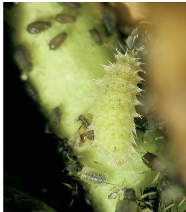
Paragus absidatus . La larve de cette espèce de pelouses montagnardes et alpines se nourrit de pucerons sur grandes herbacées (épilobe, cirse, gentiane jaune).

• Larves phytophages : troisième et dernier type de régime alimentaire, il concerne presque autant d'espèces que le précédent (un peu plus de 130 espèces en France et près de 180 en Europe). À de très rares exceptions près, dont le genre Pelecocera avec ses 5 espèces françaises est un exemple, on peut dire que seuls 3 genres de la sous-famille des Milesiinés entrent dans cette catégorie : Cheilosia , Eumerus et Merodon . Assez curieusement, ce sont également 3 genres difficiles sur un plan systématique, pour lesquels des clés fiables sont, au mieux, sur le point de voir le jour ( Cheilosia ), au pire espérées pour ce siècle ( Merodon )... Les larves des espèces du genre Cheilosia vivent, pour la quasi-totalité des espèces pour lesquelles on connaît le milieu de vie larvaire, en mineuses parfaitement phytophages dans les tiges ou les racines de diverses plantes dont beaucoup d'Astéracées, mais aussi