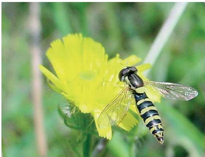
Sphaerophoria scripta femelle. Espèce présente dans diverses formations herbacées ouvertes de plaine comme d'altitude. Comme E. balteatus , c'est un auxiliaire précieux des cultures qui migre vers le Sud de l'Europe en automne.

èces dont on connaît le mode de vie larvaire, sont apparemment bien phytophages, mais on envisage de plus en plus qu'il puisse s'agir, pour certaines espèces au moins, d'une saprophagie partielle. En effet, les tissus vivants attaqués dépérissent vite, pourrissent et sont le milieu de développement des larves de plusieurs espèces. Les plantes hôtes sont pour l'essentiel des Liliacées, mais on compte aussi des Amaryllidacées. Une espèce assez courante pose d'ailleurs régulièrement des problèmes aux horticulteurs du Sud-Est de la France : la Mouche des bulbes, Merodon equestris . Eumerus funeralis peut également passer pour un ravageur primaire alors qu'il semble avoir besoin de bulbes déjà blessés ou endommagés par des bactéries ou des champignons. Le cas est iden-