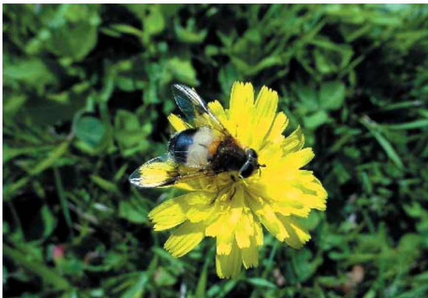
Leucozona lucorum femelle. L'espèce fréquente les milieux mi-ouverts des régions humides et de montagne. Sa larve se nourrit de pucerons sur grandes herbacées et arbustes.

C'est parmi les habitats de milieux ouverts que l'on observe le plus grand contraste de situations. On y trouve en effet les différents types de formations herbacées (des prairies de plaine plus ou moins intensivement exploitées aux pelouses montagnardes puis alpines acidiphiles ou calcaires, en passant par les macrophorbiaies), les lisières forestières thermophiles, les landes, les marécages et tourbières mais aussi les cordons dunaires et marais salés, les ébou-