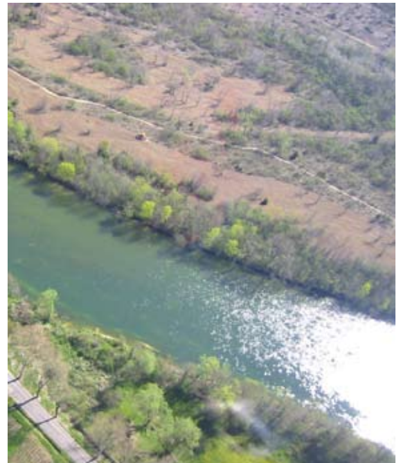
Les brotteaux de l'Ain ont fait l'objet d'une concertation particulière liée à la recherche d'éleveurs prêts à participer à l'entretien de l'espace. Les réunions publiques organisées ont été en partie informatives mais surtout des séances de concertation visant à construire avec les éleveurs un projet de pâturage qu'ils puissent s'approprier.

La prise en compte de l'intérêt général et des enjeux environnementaux est un élément de l'évaluation de la concertation qui ne peut pas toujours être exprimé par les acteurs eux-mêmes. Pour avoir une évaluation complète, il faut aussi interroger les acteurs institutionnels qui peuvent avoir une vision plus globale.