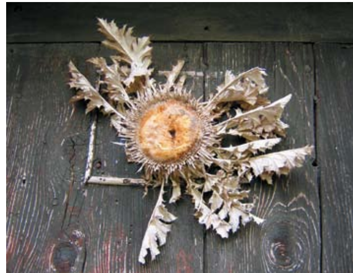
L'incidence de la symbolique de certaines plantes ou de certains animaux est à ne pas prendre à la légère.

Dans les présentations techniques, essayons d'oublier un instant notre savoir-faire au bénéfice d'un peu plus de sentiments : une fleur peut être belle et sentir bon avant d'être rare !