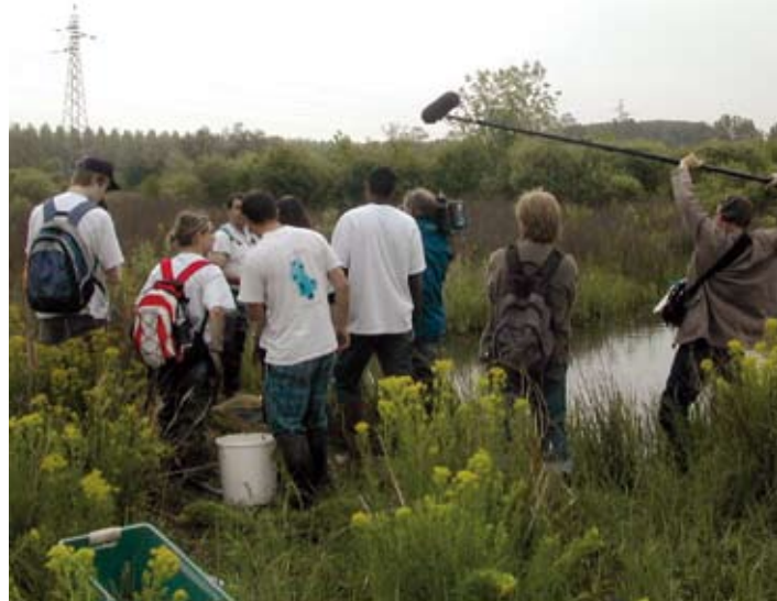
Le tournage d'un film sur le thème "agriculture et biodiversité" a été une excellente relance du lien social avec quelques membres du comité de pilotage d'un site du Rhône mais aussi un retour de points de vue intéressant pour l'animateur.

Mais s'il n'y a pas de neuf, ne culpabilisons pas et faisons jouer notre imagination. Pourquoi ne pas planifier une nouvelle phase au projet, ajouter un volet pédagogique, en profiter pour étendre le territoire considéré et relancer une nouvelle concertation avec plus de recul, une plus forte neutralité vis-à-vis du projet ?