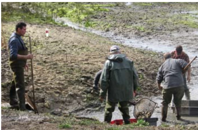
Sur ce site privé bénéficiant d'un arrêté de biotope, le point d'entrée a été le dérangement par le public et la sollicitation d'un affichage réglementaire. La concertation avec l'exploitant de la pêche et le propriétaire s'est progressivement élargie à un comité plus large et le gestionnaire s'est trouvé dans un rôle d'assembleur.

S'il se considère comme le seul capable de décider d'une opération de gestion, il devra se demander s'il souhaite une concertation (dans laquelle les acteurs participent à la décision) ou une consultation (dans laquelle il décide après une prise d'avis).