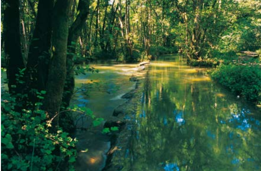
Certains éléments de patrimoine constituent une excellente porte d'entrée à la concertation, tel ce système d'acheminement des eaux, objet de tourisme local.

De même la culture locale, issue de l'histoire des hommes, peut expliquer des comportements inattendus, des attachements forts... C'est ainsi que, dans l'Ain, lors de l'application du plan de gestion d'un étang en contexte boisé, les réactions ont été vives. L'objet du désaccord était lié aux conifères plantés il y a de nombreuses années. Un attachement local à cette essence était né, à son usage important comme litière pour les troupeaux et le revenu complémentaire non négligeable que des familles pouvaient en tirer à l'époque. Pour le gestionnaire, ce pin d'origine américaine était plutôt une anomalie dans la biodiversité locale.