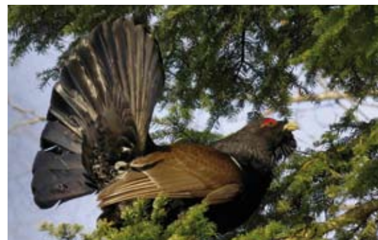
Le "grand coq", un animal sujet à de longues discussions.

L'appui d'une personne charismatique ou d'un partenaire reconnu localement peut aider pour certains contacts, notamment pour faire comprendre ce que veut l'animateur ou renforcer l'importance du projet. Le rôle de personnes atypiques, parce qu'elles appartiennent à plusieurs "mondes" (par exemple agriculture et éducation, urbain et rural...), peut quelquefois favoriser une passerelle entre deux cultures différentes.