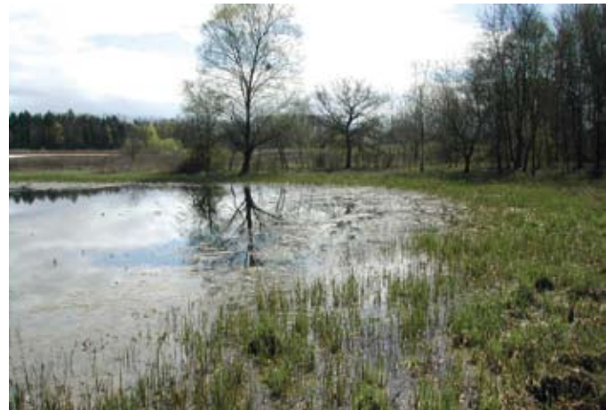
Ces petites phrases qui ne sont pas anodines et qu'il faut savoir repérer. C'est le cas du maire d'une commune du Rhône qui soulignait que, plus jeune, il venait braconner les brochets frayeurs sur ce marais. Derrière cette anecdote s'exprimait un attachement fort au site dont il a fait preuve jusqu'aux dernières élections.

Cependant l'oubli d'un acteur est toujours possible ; son intégration en cours de route l'est aussi mais demande une attention particulière pour la mettre "au même niveau", au moins en termes d'information.