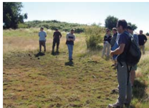
Au centre du cercle, c'est une mare avec de magnifiques plantes. Là plus qu'ailleurs un peu de recul et des explications appropriées sont indispensables pour que ces mares temporaires deviennent l'affaire de tous.

Les préjugés existent, il faut en tenir compte mais surtout avoir conscience que nous sommes tous porteurs de jugements plus ou moins conscients qui ne vont pas