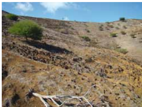
En l'absence de gestion, les cerfs et les lapins introduits sur l'îlot Leprédour (Nouvelle-Calédonie) sont à l'origine de la disparition du couvert végétal et d'une forte érosion des sols.

L'introduction d'herbivores a des conséquences sévères sur les flores indigènes et sur la structure des communautés végétales. Les populations sauvages ou en semi-liberté de bovins, de chèvres, de moutons, de lapins et de cervidés observées aux Saintes en Guadeloupe, dans les îles de Polynésie française, en Nouvelle-Calédonie, dans les îles subantarctiques ou à Saint-Pierre et Miquelon causent à des degrés divers des destructions du couvert végétal et des régressions d'espèces indigènes. A Saint-Pierre et Miquelon, la régénération de la seule forêt boréale française est gravement compromise par les impacts conjugués du Cerf de Virginie, du Lièvre d'Amérique et du Lièvre arctique, trois herbivores introduits à des fins cynégétiques. Un autre exemple édifiant est celui du Lapin. Dans l'archipel de Kerguelen, il a éliminé deux espèces clés de plantes, le Chou de Kerguelen et l'Azorelle, dont les distributions se limitent aujourd'hui aux secteurs non occupés par cet herbivore. Le surpâturage excessif des herbivores introduits favorise et accélère les processus d'érosion, lesquels, dans certaines localités, peuvent être extrêmement marqués.