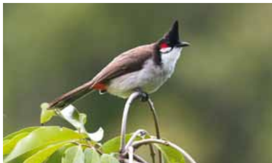
© S. Caceres et J.N Jasmin