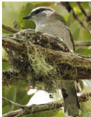
Sur l'île de La Réunion, l'Echenilleur de La Réunion, un oiseau endémique en danger critique d'extinction est particulièrement menacé par des prédateurs introduits, notamment les rats et les chats.

Des mécanismes de compétition pour les ressources alimentaires ou pour l'espace, d'hybridation ou de transferts de parasites et de pathogènes sont également à l'œuvre. Ces phénomènes, plus cryptiques, sont généralement moins étudiés à ce jour en outre-mer. Parmi les oiseaux introduits, le Martin triste, le Bulbul Orphée et le Bulbul à ventre rouge sont suspectés d'être en concurrence avec des oiseaux indigènes et de contribuer à la régression de leurs populations. L'Iguane commun introduit aux Antilles françaises menace par compétition et hybridation l'Iguane des Petites Antilles, une espèce en danger d'extinction, subissant par ailleurs l'impact d'herbivores et de carnivores introduits.