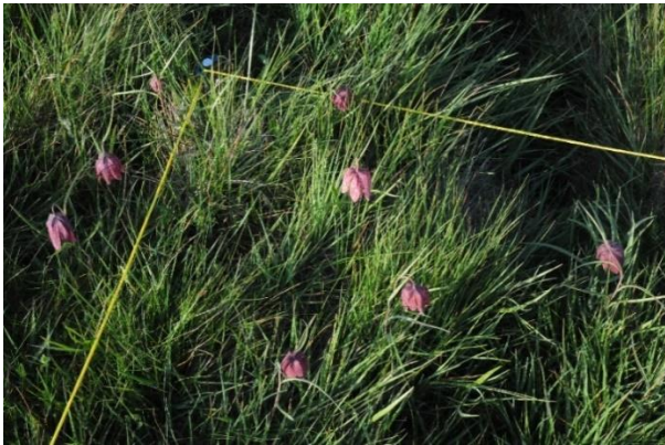
Photo 3 - Angle d'un quadrat de 5 x 5 m et Fritillaires