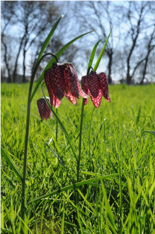
Photo 1 verticale ( légende : Fritillaires pintades en pleine floraison )