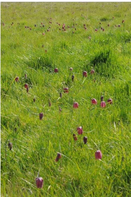
Photo 2 verticale ( légende : Fritillaires pintades en zone de forte densité, mais hétérogène )

Les prairies vertes de mars sont ponctuées de clochettes de couleur vermillon à violine suivant l'éclairage. Il doit y en avoir des centaines ... même des milliers !... Oui, mais plus précisément ? Ces prairies mitoyennes totalisent 62.000 m 2 nets ( hors mare, ruisseaux, talus, etc.). Impensable de compter tous les individus. Il faut échantillonner. Oui, mais comme on le voit sur la photo, la répartition du peuplement n'est pas homogène du tout ... Si je compte ici, j'en ai 10 au m 2 ... Si je compte là, j'en ai 1 au m 2 ... Prise de tête !