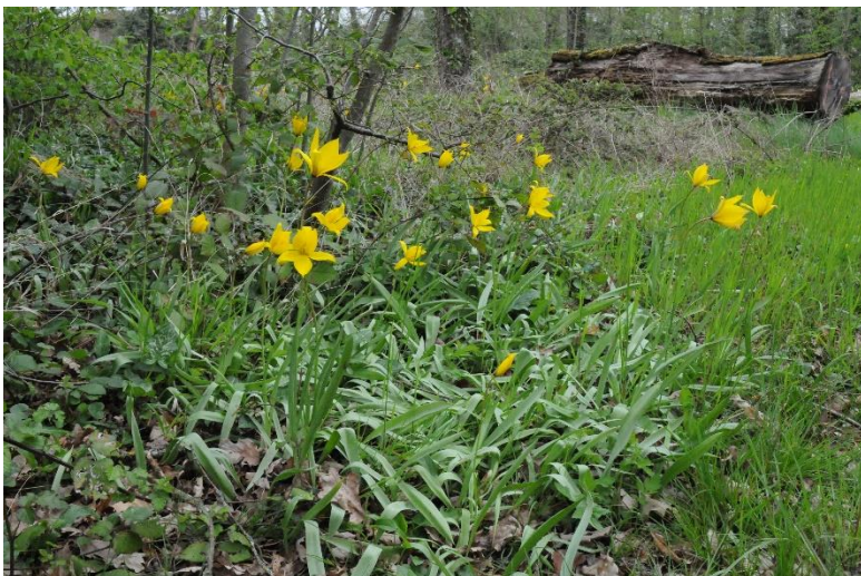
Touffe de Tulipes des bois, partiellement en fleurs.

Moralité de l'histoire : chaque cas est unique et il faut se garder de vouloir extrapoler aveuglément une méthode qui a marché avec une espèce pour une autre espèce ... ce serait trop facile !