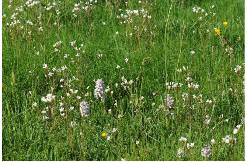
Orchis lactés au milieu de Saxifrages granulées, en prairie.