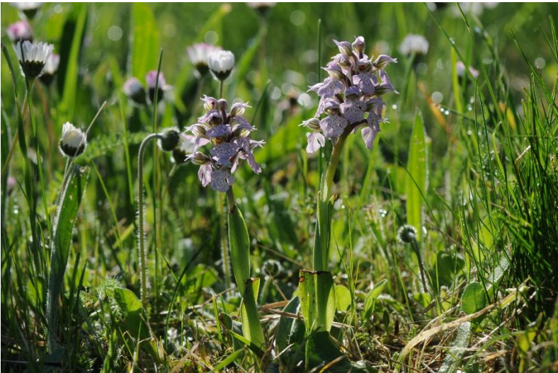
Orchis lactés ... à ras des pâquerettes !...