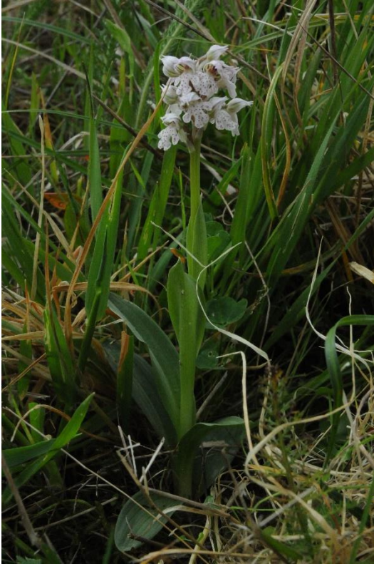
Pied d'Orchis lacté en fleurs.