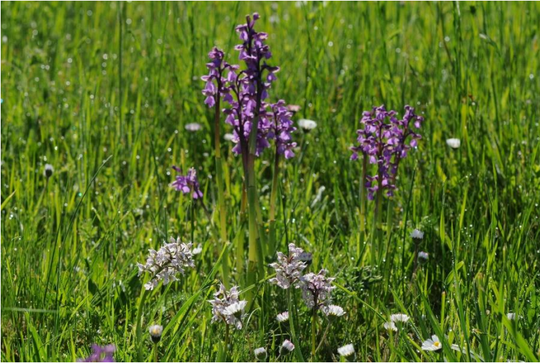
Orchis lactés « à l'ombre » d'Orchis bouffons.