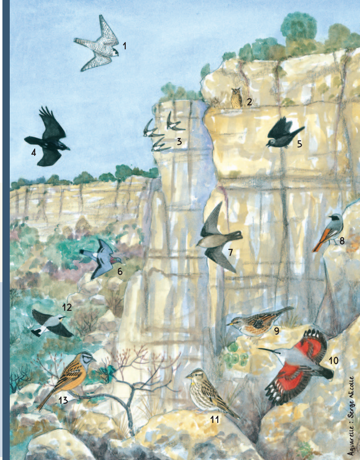
1 • Faucon pèlerin - 2 • Hibou grand-duc - 3 • Martinet à ventre blanc 4 • Grand corbeau - 5 • Choucas des tours - 6 • Pigeon colombin - 7 • Hirondelle des rochers - 8 • Rouge-queue noir - 9 • Accenteur alpin - 10 • Tichodrome échelette 11 • Moineau souldie - 12 • Traquet motteux - 13 • Bruant fou

D'autres espèces d'oiseaux fréquentent aussi les falaises et peuvent être sensibles aux dérangements. Ici, il s'agit notamment du Martinet à ventre blanc, de l'Hirondelle de rochers et du Grand Corbeau.