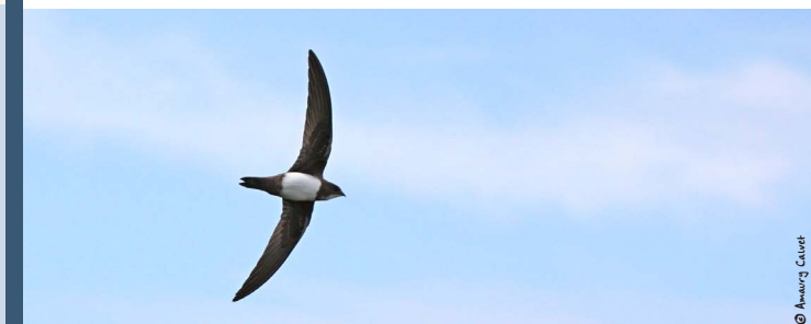
Martinet à ventre blanc

D'autres espèces d'oiseaux fréquentent aussi les falaises et peuvent être sensibles aux dérangements. Ici, il s'agit notamment du Martinet à ventre blanc, de l'Hirondelle de rochers et du Grand Corbeau.