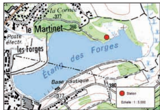
Figure n° 3 : localisation de la station d' Amorpha fruticosa , étang des Forges à Offemont (90). Fond cartographique : scan25 IGN, 2007

Lors d'un travail de cartographie des enjeux floristiques de l'étang des Forges (VUILLEMENOT, 2011), un individu de faux-indigo a été observé au sein d'une petite clairière au contact d'une chênaie pédonculée acidophile à crin végétal et d'une saulaie marécageuse à saule cendré (voir figure n° 3). Bien