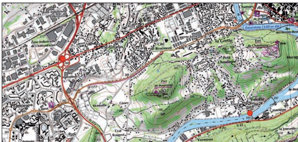
Figure n° 2 : localisation des stations d' Amorpha fruticosa signalée en 2011, Besançon (25). Fond cartographique : scan25 IGN, 2007

Deux stations ont été signalées à Besançon. L'une au niveau du pont Velotte, et l'autre entre les quartiers de Saint-Ferjeux et de Planoise (voir figure n° 2). Toutes deux étaient connues par le Service des espaces verts, sportifs et forestiers de la Ville de Besançon depuis quelques années.