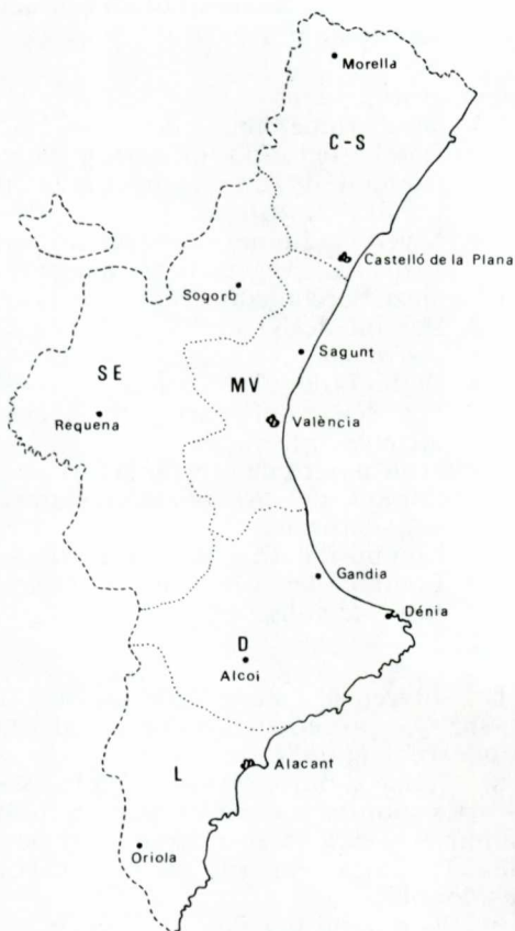
Fig. 1. Unitats fisiogràfiques primàries del País Valencià. C-S: Territori Catalanidic (meridional). SE: Territori Serrànic. MV: Territori Mediovalentí. D: Territori Diànic. L: Territori Lucèntic. Die grossen physiographischen Raumeinheiten des Valencia-Landes. C-S: (Süd)katalanisches Gebiet, SE: Serranisches Gebiet, MV: Mittelvalentinisches Gebiet, D: Dianisches Gebiet, L: Lucentisches Gebiet.

Cap al sud disminueixen fortament, sobretot a partir de Castelló de la Plana. Entre Castelló i València es manifesta un màxim d'ariditat notable: Sagunt rep només 344 mm anuals, dels quals cauen a l'estiu (juny, juliol, agost) 29 mm solament. Terra endins aquest mínim de pluviositat és sensible sobretot a les comarques del Camp de Túria i dels Serrans, al sud de la Serra d'Espadà, muntanya que capta encara una certa humitat. Al sud de la ciutat de València, en entrar en el camp d'influència de les Muntanyes Diàniques, les precipitacions tornen a augmentar i arriben a un màxim important al vessant sep-