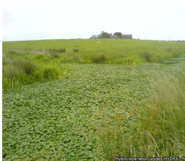
Hydrocotyle ranunculoides (Photo: EPPO), Invasion de l'Hydrocotyle en Grande-Bretagne, Aquatic Plant management Group, Jonathan Newman